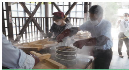
●地獄蒸し工房鉄輪