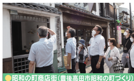
●昭和の町商店街(豊後高田市昭和の町づくり)