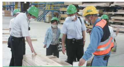
●中国木材(株)日向工場

15日は福岡県北九州市のミクニワールドスタジアム北九州を訪問。本県で検討されている秋田市外旭川構想へのスタジアム導入・運営の参考となりました。