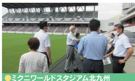
●ミクニワールドスタジアム北九州